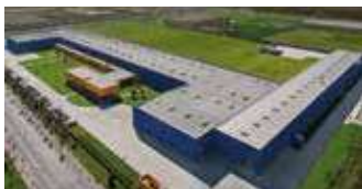
Hörmann Tianjin, China