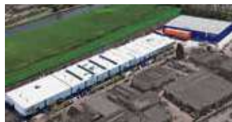
Hörmann Alkmaar B.V., Niederlande