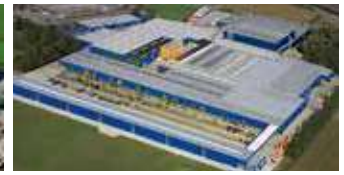
Hörmann KG Brockhagen, Deutschland