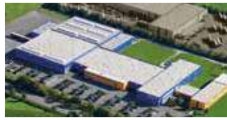
Hörmann KG Antriebstechnik, Deutschland