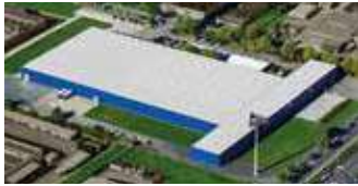
Hörmann KG Dissen, Deutschland