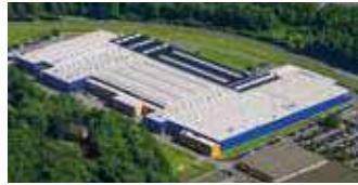
Hörmann KG Eckelhausen, Deutschland