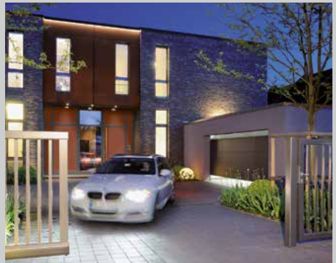
Garagentore und Torantriebe

Wählen Sie aus dem umfassenden Programm für Neubau, Ausbau und Modernisierung.