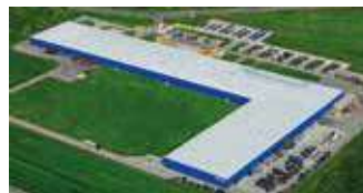
Hörmann Legnica Sp. z o.o., Polen