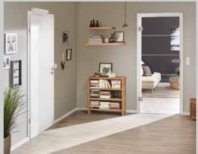
Wohnraamtüren und Türantriebe