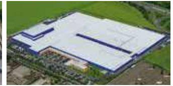
Hörmann KG Ichtershausen, Deutschland