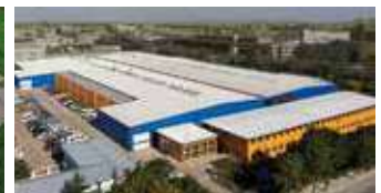
Hörmann Beijing, China