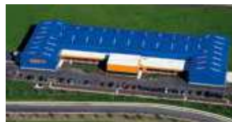
Hörmann Flexon LLC, Burgettstown PA, USA