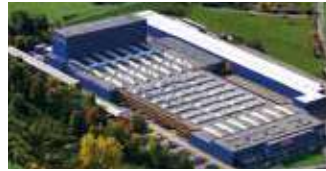
Hörmann KG Freisen, Deutschland