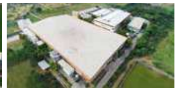
Shakti Hörmann Pvt. Ltd., Indien

Als einziger Hersteller auf dem internationalen Markt bietet die Hörmann Gruppe alle wichtigen Bauelemente aus einer Hand. Sie werden in hochspezialisierten Werken nach dem neuesten Stand der Technik gefertigt. Durch das flächendeckende Vertriebs- und Servicenetz in Europa und die Präsenz in Amerika und Asien ist Hörmann Ihr starker, internationaler Partner für hochwertige Bauelemente. In einer Qualität ohne Kompromisse.