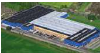
Hörmann KG Werne, Deutschland