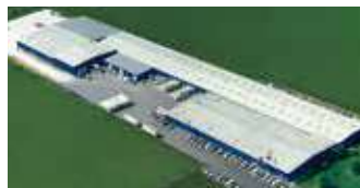
Hörmann LLC, Montgomery IL, USA