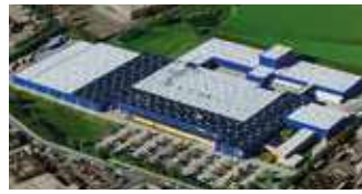
Hörmann KG Brandis, Deutschland