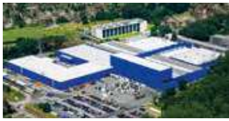
Hörmann KG Amshausen, Deutschland